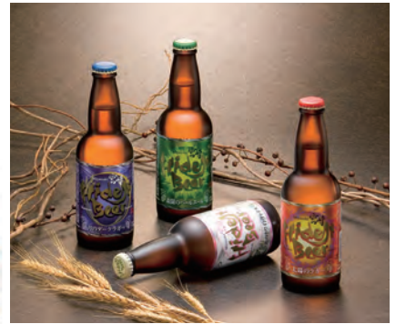
宮崎ひでじビール