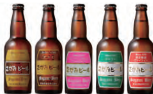
黄金井酒造さがみビール